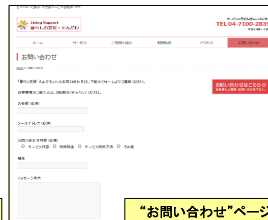
“お問い合わせ”ページ