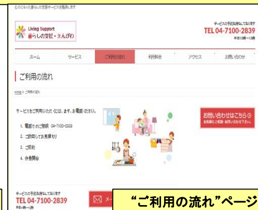
“ご利用の流れ”ページ